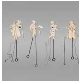
Bettlerfiguren aus einem Schattentheater Reproduktion

Das Ausstellungs-möbel wurde für das Projekt „Temporäre Permanenz“ im Senckenberg Naturmuseum Frankfurt entwickelt. Gefördert vom Bundesministerium für Bildung und Forschung.