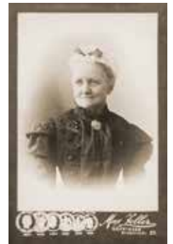
Fotografie einer Patientin

Mittwoch, 04.10. / 08.11. / 06.12.2023 sowie 03.01. / 07.02. / 06.03. / 03.04.2024, 18 Uhr