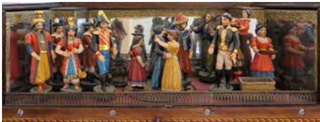
Drehorgel mit Figurenbühne, Waldkircher Orgelstiftung

Gemeinsam mit dem Heimat- und Landschaftspflegeverein Yach hat das Elztalmuseum in den vergangenen drei Jahren zahlreiche persönliche Beispiele von Menschen, die aufgrund ihrer Religion, ihres Berufs, ihrer persönlichen Situation oder sexuellen Orientierung am Rande der Gesellschaft lebten, recherchiert.